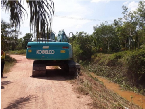
รูปก่อนดำเนินการก่อสร้าง

พิกัดที่ตั้งโครงการ : เส้นรุ้ง(ละติจูด).....๗.๗๗๙๒๗๒.....เส้นแวง(ลองจิจูด).....๑๐๐.๐๓๓๐๗๖