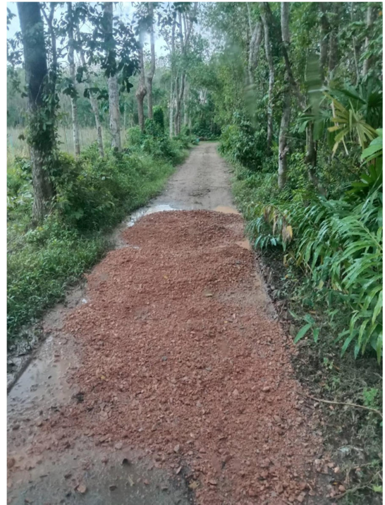
ซ่อมแซมถนนสายซอยในโหล หมู่ที่ ๕ กว้าง ๔.๐๐ เมตร ยาว ๓๐๐ เมตร