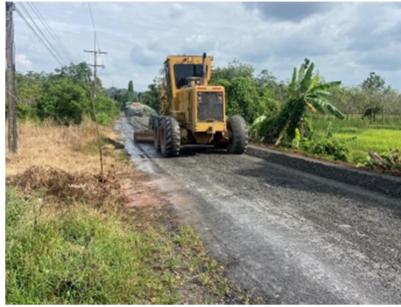
กำลังดำเนินการก่อสร้าง