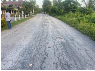
ก่อนดำเนินการก่อสร้าง