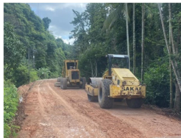
กำลังดำเนินการก่อสร้าง